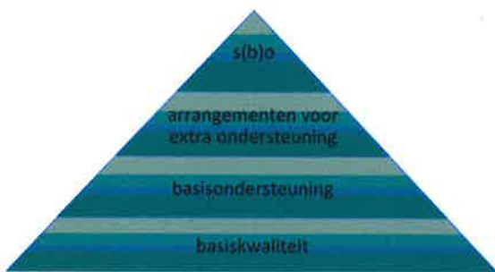
Figuur 1: Niveaus van ondersteuning

Passend onderwijs voor ieder kind dat woont in de Kempen wordt gerealiseerd door basiskwaliteit en basisondersteuning op alle 77 basisscholen, door passend arrangeren voor leerlingen op basisscholen die extra ondersteuning nodig hebben en, als het echt niet anders kan, toeleiding tot speciaal basisonderwijs of speciaal onderwijs. Zie figuur 1.