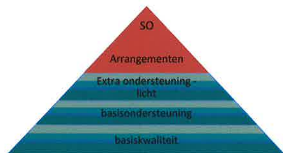
Figuur 2: Verantwoordelijkheidsverdeling

basisondersteuning, de extra ondersteuning – licht (arrangementen gefinancierd uit de middelen lichte ondersteuning) en voor de toeleiding tot speciaal basisonderwijs. Indien een leerling een arrangement nodig heeft dat gefinancierd wordt uit de middelen extra ondersteuning – zwaar of toe geleid moet worden naar het speciaal onderwijs, dan moet dat aangevraagd worden bij het SWV PO De Kempen (zie ook paragraaf 5: proces toeleiding tot extra ondersteuning). Figuur 2 brengt dit in beeld.